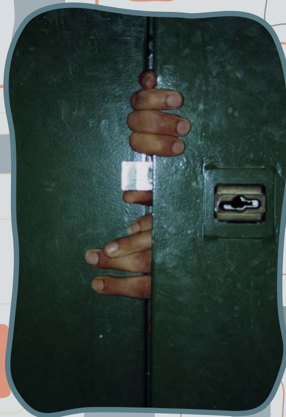
Fotografia di Paolo Ele, Mani , da Captivi . Si ringrazia L'Associazione Sesta Opera San Fedele – Milano

Tali azioni sono prevalentemente incentrate sulla tutela dei diritti, sull'accoglienza abitativa e sull'attivazione di reti che possano costruire percorsi personalizzati di inserimento sociale e lavorativo esterni al carcere.